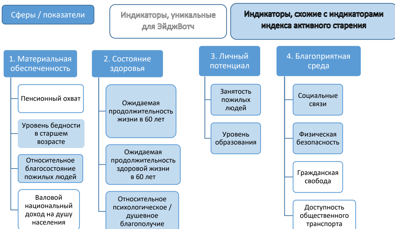
Рисунок 1. Структура глобального индекса ЭйджВотч

Разная структура – разные результаты: так, в индексе активного старения Польша уступает Литве и Латвии, а в глобальном индексе ЭйджВотч занимает более высокую позицию.